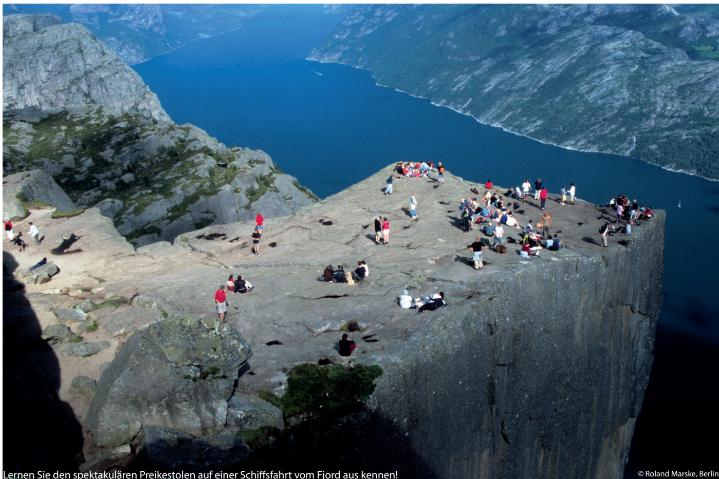
Lernen Sie den spektakulären Preikestolen auf einer Schiffsfahrt vom Fjord aus kennen!