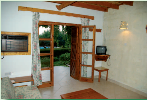
Maisonetten, unterer Wohnbereich und oberer Schlafbereich