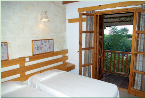
Superiorzimmer: Wahlweise Gartenblick oder meerseitig: