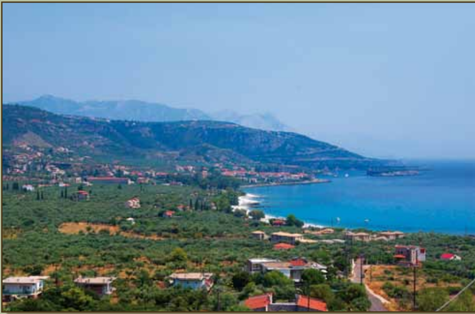
natürliche Baustoffe und Farben, Architektur und Design, Ruhe und Meer