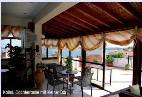
Kallitsi, Dachterrasse mit kleiner Bar

Familiär geführte kleine Anlage, etwas oberhalb des Dorfbereichs gelegen. Die Besitzer haben in Deutschland gelebt und sprechen etwas deutsch. Über einen kleinen Hügel hinter dem Haus gelangt man nach ca. 500m an den wunderschönen Strand von Ag. Nikolaos. Einen Supermarkt und Tavernen gibt es um die Ecke. Vom Haus und der herrlichen Dachterrasse mit Barbetrieb haben Sie einen herrlichen Blick auf den Hafen und die Marina. Hier fahren auch die Ausflugsboote zu verschiedenen Zielen, wie z.B. zum Berg Athos ab. Dazu gehört ein Garten mit Barbecueplatz zur allgemeinen Benutzung sowie ein kleiner Kinderspielplatz. Alle Zimmer sind einfach und sauber eingerichtet, haben einen überdachten Balkon mit zusätzlich angebrachten Rollos als Sonnenschutz. Alle Unterkünfte haben eine kleine Küchenzeile mit 2,5-Flammenherd, Minibackofen, Wasserkocher und Kaffeemaschine sowie Kühlschrank, die Zimmer sind klimatisiert. Einfaches Bad mit Föhn und Dusche ohne Vorhang. In den Zimmern steht deutsches Fernsehen zur Verfügung, vor den Unterkünften gibt es Sitzmöglichkeiten im Gemeinschaftsbereich, die Balkone haben Tisch und Balkonstühle. Es gibt 16 Studios mit Betten für 2 oder 3 Personen sowie 4 etwas größere Apartments mit einem Zusatzschlafzimmer (Doppelbett und 2 Einzelbetten) und Zusatzbett für bis zu 4 Erwachsenen und 1 Kind.