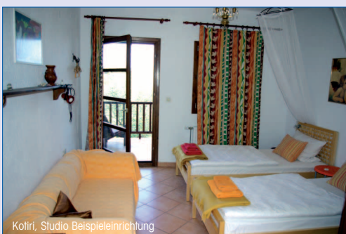
Kotiri, Studio Beispieleinrichtung

Etwa 4km nördlich des Ortes, wunderschön in einem Olivenhain gelegene, kleine, familiär geführte Studio- und Appartementsanlage. Zum Meer sind es etwa 300m, vom Kotiri und den Balkonen haben Sie einen schönen Blick über den Garten und auf das Meer. An klaren Tagen sehen Sie von hier sogar den Berg Athos! Im Ort Einkaufsmöglichkeiten, im Juli und August bringt ein Bäcker täglich Backwaren bis vor's Haus. Es gibt 4 Studios, alle unterschiedlich eingerichtet mit einfacher, aber zweckmäßigen Einrichtung, kleiner Kitchnette mit einer Grundausstattung an Geschirr, 2-Flammenherd und Minibackofen, Wasserkocher und Kühlschrank und einer kleinen Sitzgruppe. Vor den Studios genießen Sie den Meerblick vom Gemeinschaftsbalkon mit weiteren Sitzmöglichkeiten. Kleine Bäder, Dusche mit Vorhang. Außerdem steht im Kotiri eine Wohnung mit separatem Eingang, Wohnzimmer mit Klavier, davon abgehend ein offener Schlafbereich und die offene Küche mit schönem alten Küchenschrank, Kühl-/Gefrierkombination und Herd mit Ofen sowie EBTisch. Zusätzlich ein separates Schlafzimmer mit Doppelbett, Duschbad und privater, überdachter Terrasse mit Tisch und Stühlen, die in den Garten übergeht. Im Kotiri steht WIFI zur Verfügung.