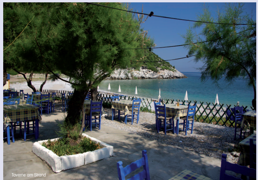
Taverne am Strand